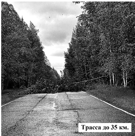
Трасса до 35 км.

Были зафиксированы отключения электроэнергии в разных микрорайонах села, вызванные повреждением линий электропередач.